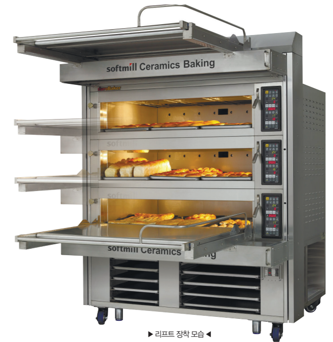
▶ 리프트 장착 모습 ◀